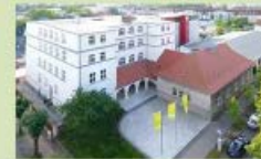
Ecolea Internationale Schule Rostock