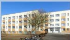
Grundschule Ostseekinder Rostock