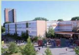
Schulcampus Rostock Evershagen